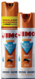
JIMO Anti-Inset Aerosol