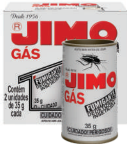
JIMO Gás Fumigante