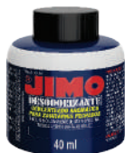
JIMO Desodorizante Sanitário