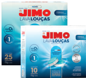
JIMO Lava-Louças Multicamadas