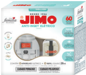
JIMO Anti-Inset Elétrico Kit 60 Noites