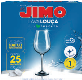
JIMO Lava-Louça Sem Fosfato