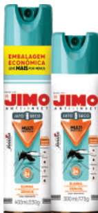
JIMO Anti-Inset Jato Seco Aerosol