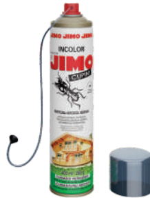
JIMO Cupim Aerosol