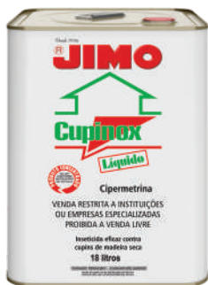
JIMO Cupinox Líquido