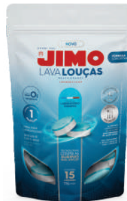
JIMO Lava-Louças Multicamadas (embalagem hidrossolúvel)