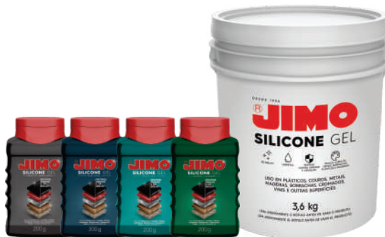
JIMO Silicone Gel