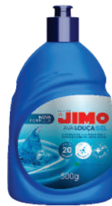
JIMO Lava-Louça Gel