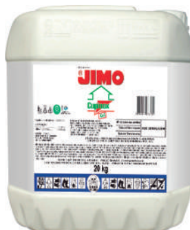
JIMO Cupinox Gel