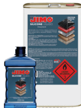
JIMO Silicone Líquido