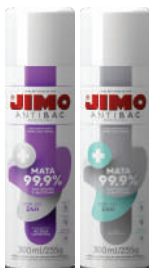
JIMO AntiBac Aerosol