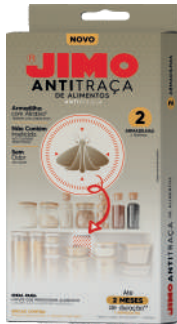
JIMO AntiTraça de Alimentos