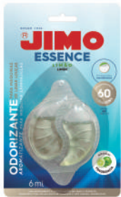
JIMO Essence Limão