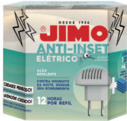
JIMO Anti-Inset Elétrico