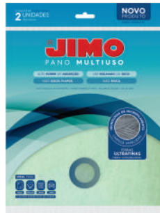
JIMO Pano Multiuso