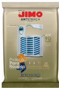
JIMO AntiTraça Cartela