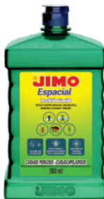
JIMO Inseticida Espacial