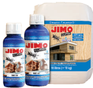
JIMO Cupim Base Água