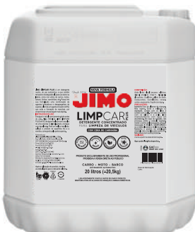
JIMO LimpCar Plus