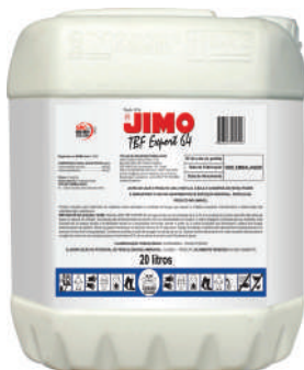
JIMO TBF Export 64