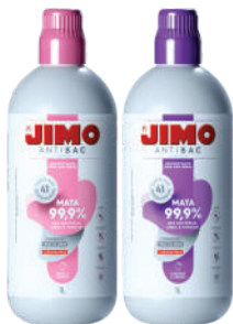
JIMO AntiBac Liquido