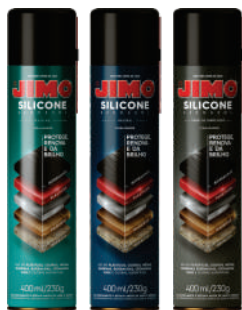
JIMO Silicone Aerosol