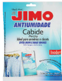
JIMO Antiumidade Cabide