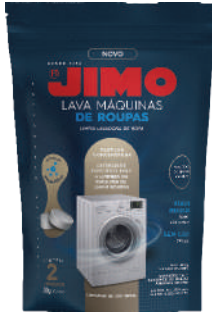
JIMO Lava-Máquinas de Roupas em pastilhas