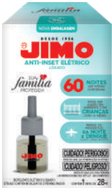
JIMO Anti-Inset Elétrico Refil Liquido