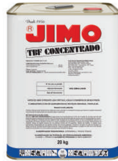
JIMO TBF Concentrado