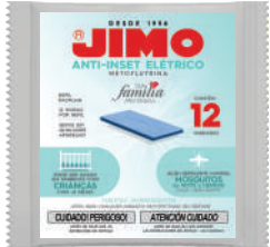
JIMO Anti-Inset Elétrico Refil Pastilha