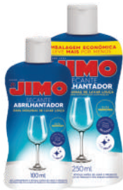
JIMO Secante Abrilhantador