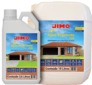
JIMO Água-Repelente 700