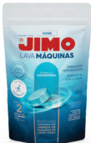
JIMO Lava-Máquinas em pastilhas